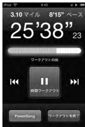
iPhone 3G S